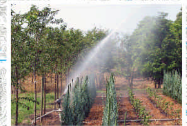
レインガンによる散水