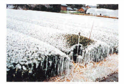
茶の防霜(散水水結法)