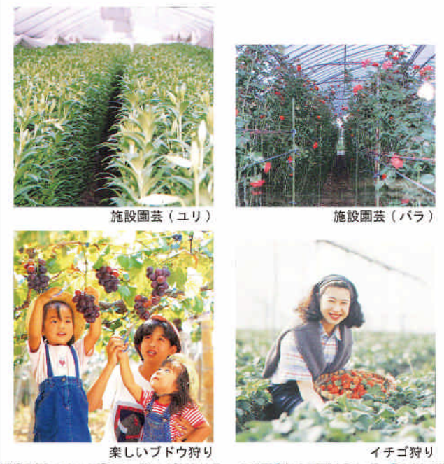
施設園芸(ユリ) 施設園芸(バラ) 楽しいブドウ狩り イチゴ狩り